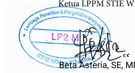
Beta Asteria, SE, MM, M.Ec.Dev

Yogyakarta, 2 Januari 2024 Ketua LPPM STIE Widya Wiwaha