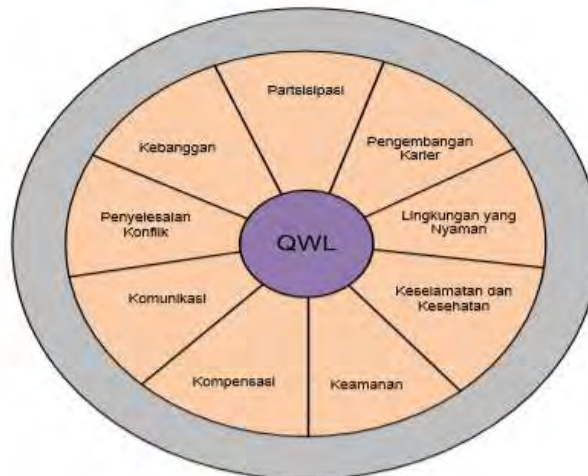
Gambar 2 Diagram Kualitas Kehidupan Kerja Sumber: Managing Human Resources , Cascio, 1995

mencegah turn over. Hal ini terbukti dari adanya beberapa indikator konsep kualitas kehidupan kerja yang telah diterapkan di CV Yogya Karya Andini seperti adanya pengembangan kemampuan melalui pelatihan, kompensasi yang sesuai dengan standar daerah setempat dan jaminan keselamatan kerja. Kendati demikian, indikator mengenai kualitas kehidupan kerja tidak hanya sebatas pada aspek kesejahteraan karyawan, melainkan meliputi berbagai aspek seperti motivasi karyawan, kepemimpinan, lingkungan kerja, disiplin kerja, budaya kerja, komunikasi, komitmen jabatan, kepuasan kerja dan sebagainya yang keseluruhan dapat mempengaruhi kinerja karyawan. Hal ini sebagaimana terlihat dari berbagai indikator kualitas kehidupan kerja menurut Cascio (1995) yang dapat dilihat pada gambar 2 dibawah ini: