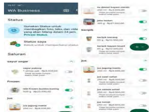
Gambar 11. WA Bisnis Toko Kompitu Sehat

Digital Marketing dilakukan dengan membuat Instagram Toko Kompitu Sehat dan Whatsapp Bisnis Toko Kompitu Sehat. Tampilan WA Bisnis KT. Kompitu Hijau dapat dilihat pada Gambar 11.