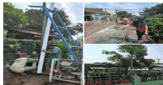
Gambar 6. Pemasangan Sumur Bor dan Listrik

Kegiatan ini dilakukan dengan penggunaan teknologi tepat guna yaitu pembuatan sumur Bor, memasang mesin air jet pump dan pemasangan listrik pada KT. Kompitu Hijau. Kendala yang ada dilapangan yaitu kekeringan air yang membuat sayur dan buah kering dan layu. Dokumentasi pemasangan Air dan Listrik dapat dilihat pada Gambar 6.