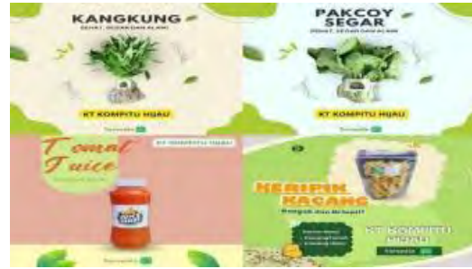
Sumber: (Dokumentasi Penulis, 2024) Gambar 9. Konten Instagram KT. Kompitu

Hasil kegiatan pelatihan dan pendampingan manajemen produksi ialah kemasan produk KT. Kompitu Hijau lebih menarik. Kemudian produk juga difoto kemudian dijadikan konten di Instagram sebagai media untuk mempromosikan produk. Dokumentasi konten Instagram foto produk KT Kompitu Hijau dapat dilihat pada Gambar 9.