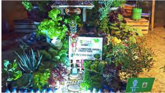
Gambar 7. Juara 1. Lomba Landscape Sayur

Hasil pemasangan instalasi sumur dan listrik ialah air mengalir deras untuk penyiraman sayuran dan buah di KT. Kompitu Hijau yang terletak di Kotabaru. Hasilnya produk pertanian unggul membuat KT Kompitu Hijau menang Juara 1 Lomba Landscape Sayur di Tingkat Kota Yogyakarta yang diikuti oleh 34 Kelompok Tani di Kota Yogyakarta. Dokumentasi Juara 1. Lomba Landscape sayur dapat dilihat pada Gambar 7.