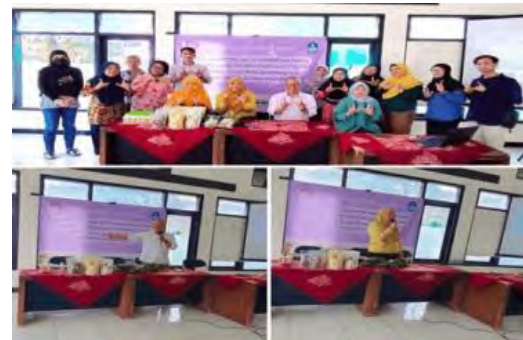
Gambar 10. Pelatihan Digital Marketing melalui SosMed dan Focus Group Discussion

4. Pelatihan Digital Marketing melalui Social Media serta Focus Group Discussion (FGD) perumusan Strategi Pemasaran Pemahaman tentang pentingnya pemasaran melalui social media dipaparkan oleh tim pengabdian. Serta FGD perumusan strategi pemasaran. Dokumentasi kegiatan ditunjukkan pada Gambar 10.