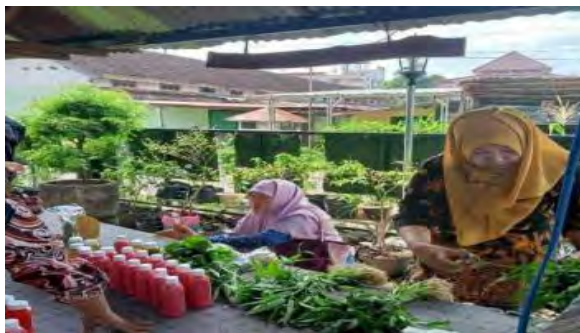
Gambar 8. Proses Kemasan Produk

3. Pendampingan Manajemen Produksi Pembuatan Kemasan Produk segar KT. Kompitu Sebagai upaya mendukung pemasaran produk melalui Aplikasi GrabMart maka diperlukan pembuatan kemasan yang menarik untuk sayur segar. Sayur dikemas cantik dan diberi stiker logo KT. Kompitu Hijau sebagai upaya menarik pelanggan untuk membeli produk tersebut. Dokumentasi pendampingan pengemasan produk KT. Kompitu Hijau dapat dilihat pada Gambar 8.