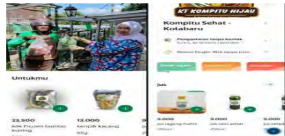
Gambar 5. GrabMart Kompitu

Setelah dilakukan pengambilan foto produk-produk KT. Kompitu Hijau diupload ke dalam aplikasi GrabMart . Dokumentasi tampilan Grabmart Toko Kompitu Sehat dapat dilihat pada Gambar 5.