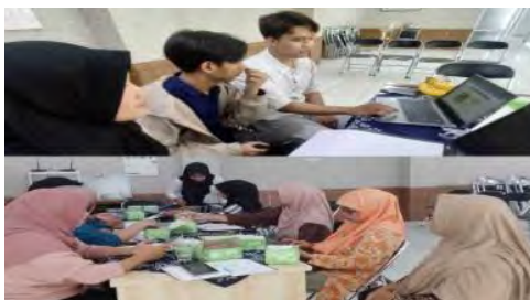
Sumber: (Dokumentasi Penulis, 2024) Gambar 3. Pendaftaran Akun GrabMart

Pendampingan pembuatan akun GrabMart untuk admin KT. Kompitu. Admin yang dipercaya menjalankan GrabMart . Pemilihan nama toko ialah Toko Kompitu Sehat untuk menarik perhatian pelanggan. Dokumentasi kegiatan pendaftaran akun Grabmart pada Gambar 3.