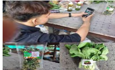
Gambar 4. Pengambilan Foto Produk

menarik pembelian secara on line. Dokumentasi pengambilan gambar produk-produk KT. Kompitu dapat dilihat pada Gambar 4.