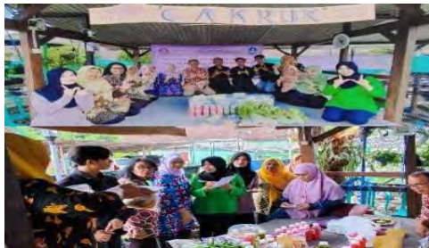
Gambar 2. Pelatihan Digital Marketing E Commerce

Hasil kegiatan ini produk yang berhasil dijual melalui E-Commerce ( Grabmart ) ialah Juice sayur (selada dan sawi), juice buah jambu. Keripik sayur, minuman jahe, minuman kunyit kuning dan dawet bayam merah. Meningkatnya penjualan secara online. Dokumentasi kegiatan Pelatihan Digital Marketing E Commerce dapat dilihat pada Gambar 2.