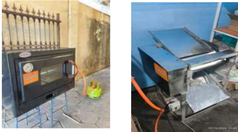
Gambar 3 Oven gas dan Mesin Pemipih Kulit Bakpia