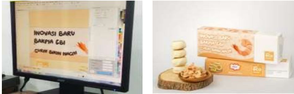
Gambar 9 Desain kemasan produk bakpia rasa Ebi

dilakukan dengan membuat desain kemasan yang menarik dengan aplikasi Canva dengan hasil sebagai berikut: