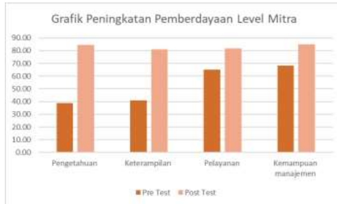
Grafik 1 Hasil Uji pre Test dan Post Tes Peningkatan Level Pemberdayaan Mitra

Hasil peningkatan level pemberdayaan mitra sebelum dilakukan kegiatan pengabdian kepada masyarakat dan setelah dilakukan kegiatan pengabdian kepada masyarakat dengan menggunakan keempat indikator tersebut disajikan dalam grafik berikut: