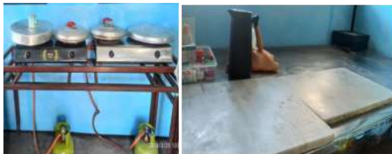
Gambar 2. Peralatan Produksi Bakpia Sek'Eco Sebelum dilakukan Pengabdian Kepada Masyarakat

Peningkatan produksi dengan inovasi bakpia rasa evi dilaksanakan dengan tahapan melakukan Observasi ke rumah produksi bakpia Sek'eco untuk mengetahui kondisi mitra, menganalisis peluang dan tantangan dalam membuat varian ebi. Berdasarkan hasil Observasi diketahui bahwa selama ini mitra masih menggunakan kompor gas untuk memproses pembuatan bakpia dan belum memiliki vacuum sealer yang menyebabkan produk tidak awet.