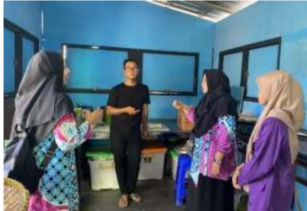
Gambar 5 Sosialisasi di rumah produksi Bakpia Sek'eco