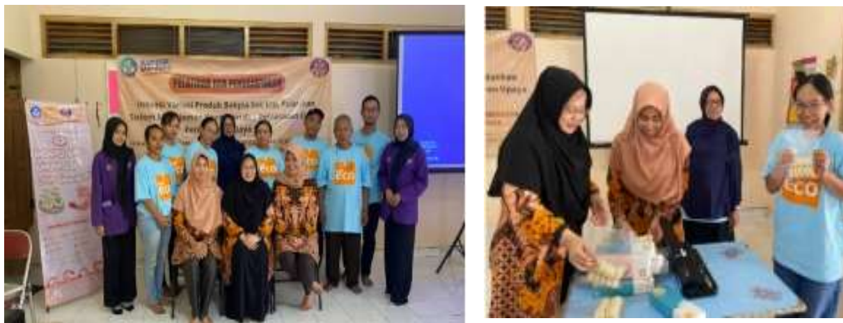
Gambar 6 Pelatihan dan Pendampingan Mitra Bakpia Sek'eco

Pelatihan ini dilakukan dengan menoperasikan alat-alat produksi baru untuk menghasilkan bakpia dengan citarasa gurih yaitu bakpia ebi dan lebih tahan lama. Bakpia Sek'Eco sebagai mitra memiliki peran dan partisipasi dalam kegiatan ini antara lain adalah bersama-sama melakukan brainstorming inovasi produk, pencarian dan pemilihan bahan baku serta alat produksi untuk ketahanan konsumsi produk, menyediakan waktu, tempat dan peralatan yang sudah ada untuk praktik produksi. Kegiatan pelatihan dilakukan di Gedung Widoro Laut, Ngampilan Yogyakarta. Berikut adalah dokumentasi kegiatan pelatihan produksi bakpia rasa ebi: