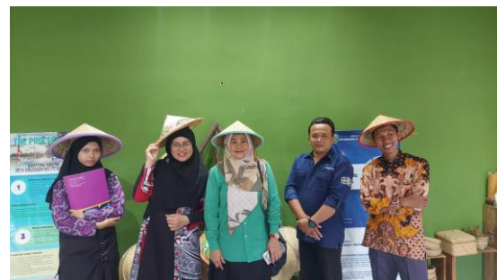
(b) Survey Produk Lokal Kampung Tudung