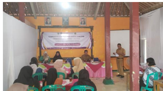
(d) Workshop Digital Marketing dan Keuangan