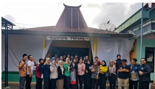
(c) Pelatihan Digital Marketing dan Content Creator