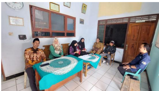
(a) Diskusi Program PKM dengan Perangkat Desa

Berikut adalah dokumentasi kegiatan PKM: