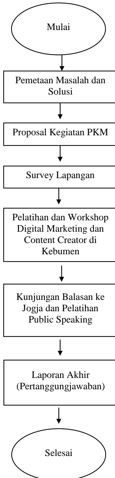
Gambar 1 Skema Kegiatan PKM

pertanggungjawaban. Hasil dari Pengabdian Kepada Masyarakat (PKM) ini dapat dilihat dari keberhasilan konten media sosial Desa Grujungan yang semakin aktif dan mampu menyajikan konten yang menarik baik dalam bentuk foto maupun video. Selanjutnya pengembangan dapat dilihat dari semakin banyaknya pengikut akun media sosial Instagram Desa Grujungan sebagai desa yang memiliki potensi wisata lokal yang menarik. Berikut adalah kegiatan Skema Pengabdian Kepada Masyarakat dari mulai sampai dengan selesai.