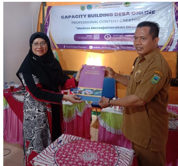
(f) Serah Terima Kesepakatan Kerjasama PKM