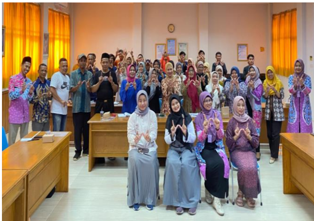
(e) Workshop Public Speaking di STIE WW